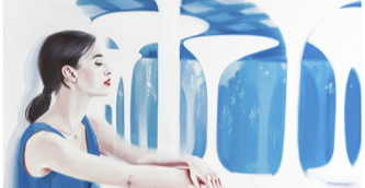
قاعة الانتظار (2018) بواسطة مارينا فيدوروفا