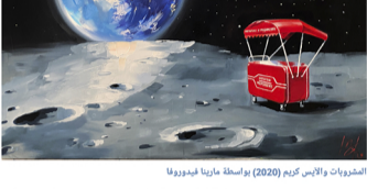
المشروبات والأيس كريم (2020) بواسطة مارينا فيدوروفا

إقبال وافتتاح دائم على التعبير عن الذات وفضول بشأن المستقبل، تفكر الفنانة في التطورات المحتملة لسباحة الفضاء، وتصميم عربة مشروبات غازية وأيس كريم على سطح القمر أو منطلق انتظار في ميناء فضاء للركاب، أو غرفة فندق فضاء مع إطلالة شاملة على الأفق اللامتناهي للكون.