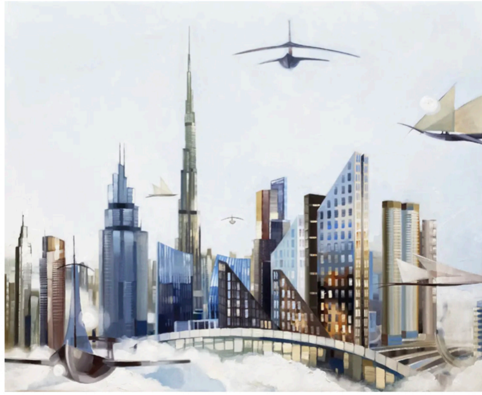
Dhow Boats (2022) by Marina Fedorova

استوحيت مارينا فيدوريفا آخر أعمالها الفنية في سلسلة كوزمودريمز من رحلتها إلى دبي (الإمارات العربية المتحدة) وقد تمثلت في قوارب شراعية جاءت نتيجة لانطباع عاشته الفنانة خلال حضورها مهرجان كانارا الشراعي التقليدي.