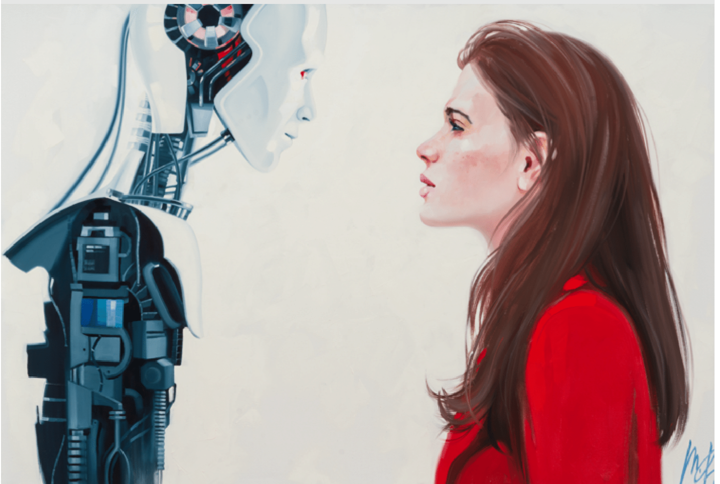
الحنين إلى الطبيعة البشرية