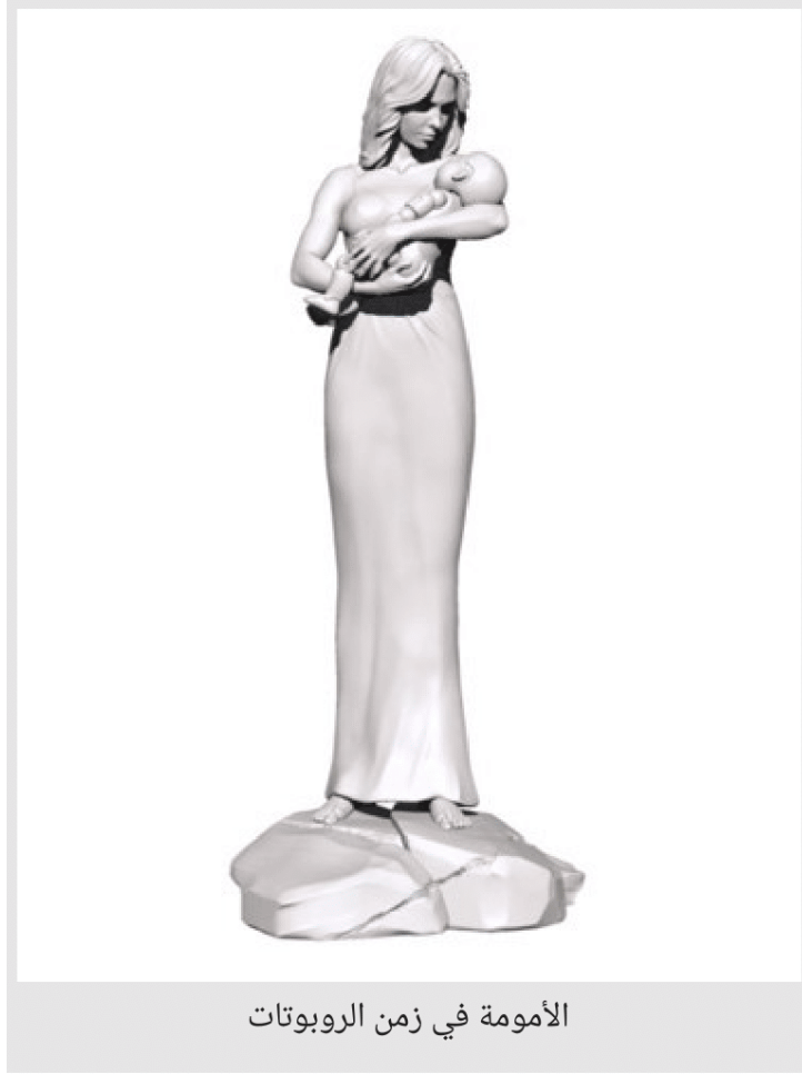
الأمومة في زمن الروبوتات

يمكنكم متابعة المزيد من اللوحات حول ملحمة كوزمودريمز الكونية من هنا