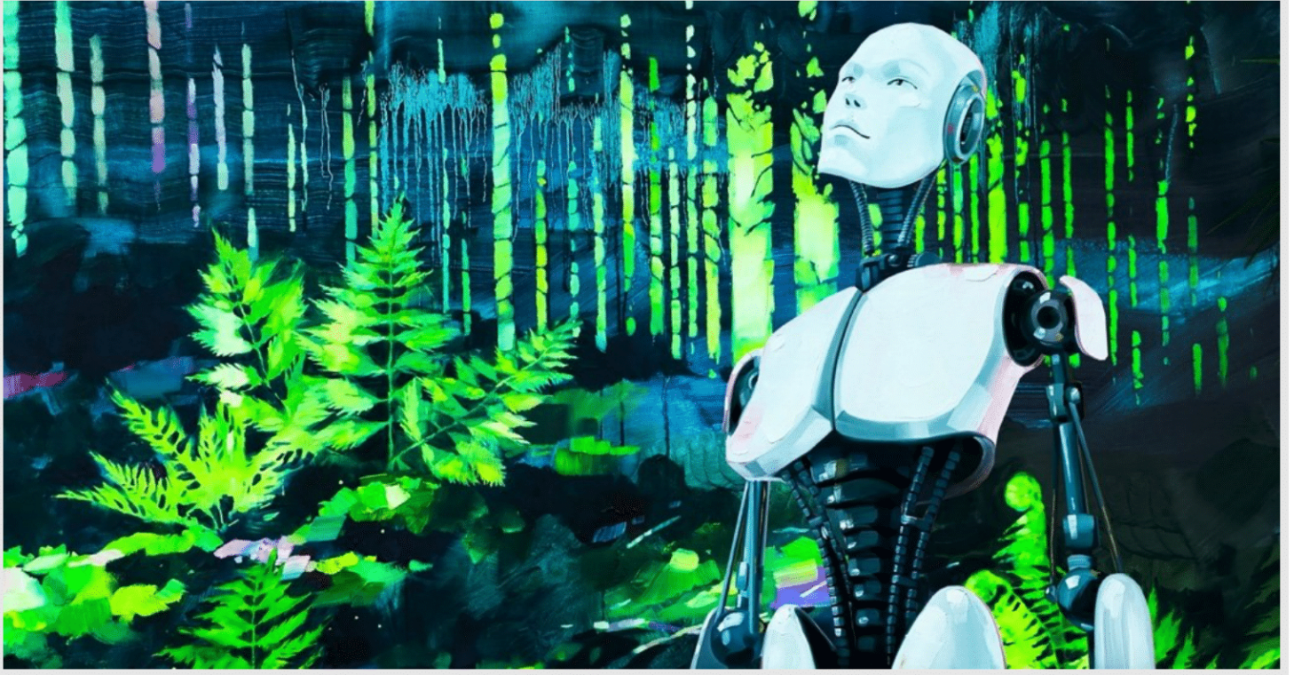
الروبوتات والطبيعة البشرية