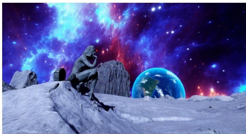
Кадр из видеоарта «Космическая одиссея»